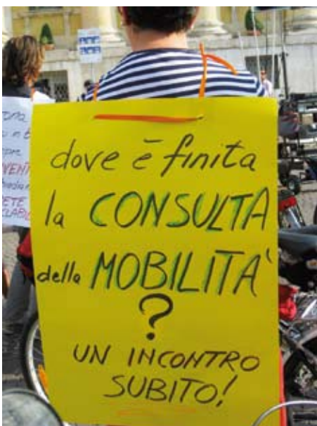
Uno dei cartelli di S.I.N.D.A.C.O.

Il programma completo (DA OTTOBRE A MARZO) è scaricabile dal sito www.teatroimpiria.net .