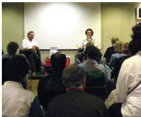
L'incontro alla FNAC

Quattro erano le iniziative messe in cantiere dalla nostra Associazione per celebrare questo importantissimo evento, voluto fortemente dall’Unio-