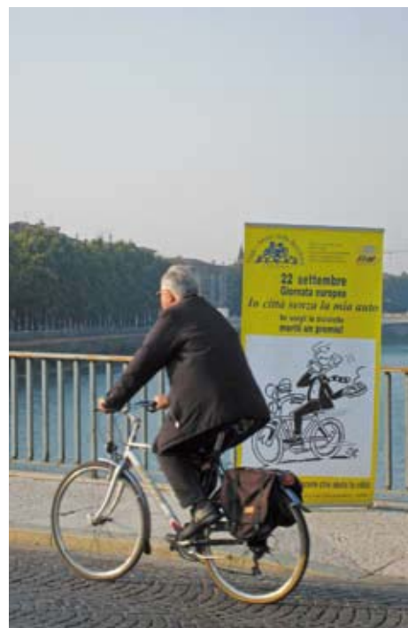
Il manifesto di Zucconelli

Sicuramente l’assenza sarà stata conseguenza di precedenti e superiori impegni presi dai nostri rappresentanti. Ma noi non ci stanchiamo tanto in fretta e ci riproveremo il prossimo anno.