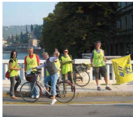
22 settembre: il varco sul Ponte Nuovo