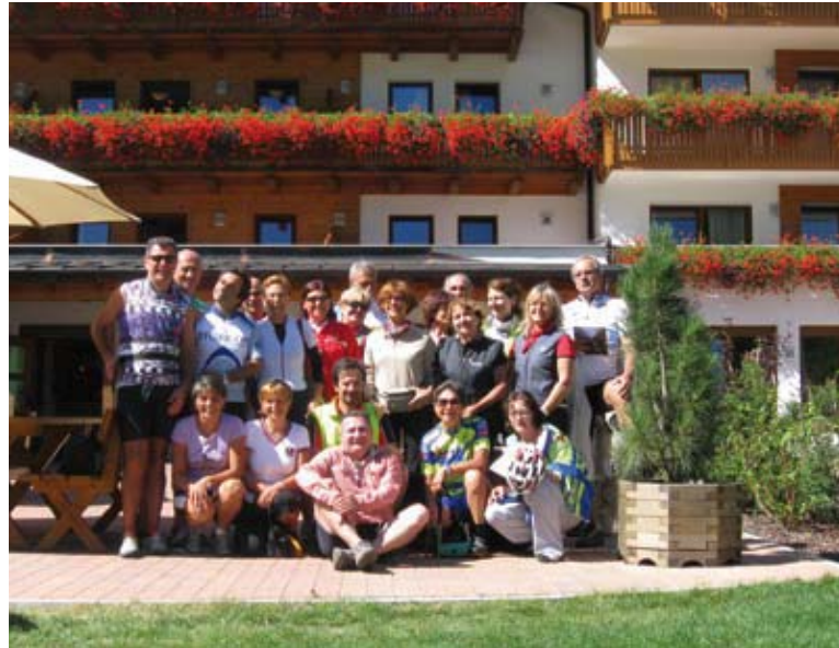
Sosta all'hotel Feuerstein in Val di Fleres

ti di roccia strapiombanti a destra. Splendido percorso! Dopo un breve giro a Bolzano, città sicuramente a misura d'uomo e di bicicletta, eccoci in stazione per il ritorno. Il Catinaccio compare sullo sfondo, ci saluta e sembra dire: ritornate presto in uno dei luoghi più belli del mondo!