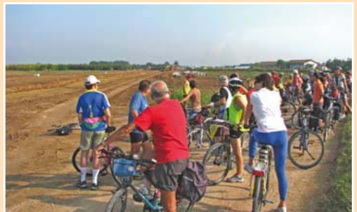
La prima delle due interruzioni

rotta, ma possa mantenere la sua integrità con la costruzione di due semplici e poco costosi sottopassi, utili anche agli agricoltori che si sono visti tagliare in due i loro fondi. Ci sono altre soluzioni? Vorremmo parlarne con chi di dovere. E nei prossimi mesi torneremo alla carica.