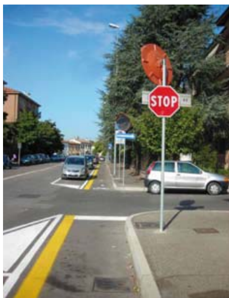
Via Monte Bianco: e l'incrocio?

Nei comunicati dell'amministrazione ripresi dall'Arena la sua la sua realizzazione è stata data per imminente almeno quattro volte l'1.5.2008 - il 3.02.09 - il 2.09.09 e il 10.10.09. Quest'ultima volta per dire che, colpa delle Ferrovie, verrà realizzata lungo viale Venezia (sul marciapiede lato ferrovia) solo nel tratto fra il