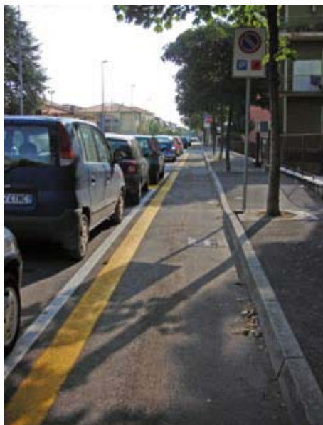
Pista di Via Monte Bianco

Vi ricordate perchè è stata dichiarata pericolosa la ciclabile di via Todeschini? Perchè correva parallelamente alle auto in sosta fra stalli e marciapiede (L'Arena 6.11.2007). Esattamente nello stesso modo è stata realizzata la nuova pista ciclabile di via Monte Bianco. Incredibile come, pur nell'epoca della globalizzazione, quello che questa amministrazione considera pericoloso in Borgo Trento diventa miracolosamente sicuro a San Michele. La pista di via Monte Bianco non è, secondo noi, insicura per via delle auto parcheggiate, ma perchè gli stalli di sosta arrivano a ridosso degli incroci (si riduce la visibilità dei ciclisti) e perchè proprio sugli incroci smette di esistere mollando chi usa la bici proprio nel momento del bisogno. Possibile che ancora oggi qualcuno lavori così male?