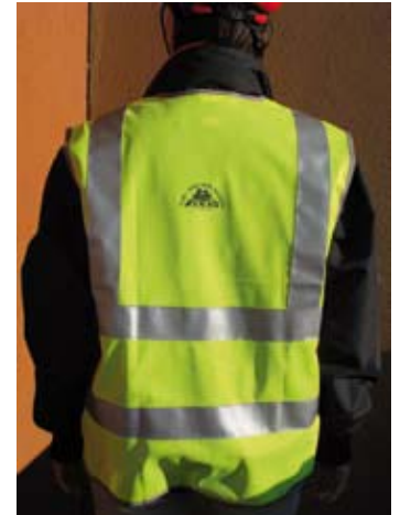
I particolari del giubbotto