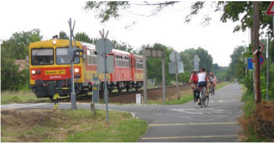
La ciclabile del Balaton

ne legato ad un piccolo rimorchiatore e in pochi minuti ci porta sull'altra sponda a Lorev. Siamo in una isola racchiusa fra due rami del Danubio. Raggiungiamo Rackeve e ci concediamo una pennichella. C'è verde, un bel ponte e l'aspetto è quasi di una città inglese. Troviamo la segnaletica EuroVelo 6 che seguiamo fino a Sziofot. Alloggio zero.