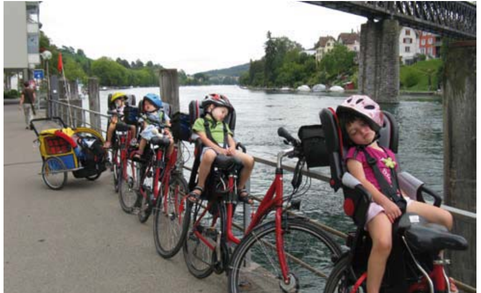
Una vacanza decisamente rilassante

Al primo cavalcavia sperimentiamo una rampa di accesso per le bici che, con una dolce salita a spirale, ti consente di affrontare il ponte senza fatica. Incredibile!