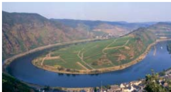
Veduta della Mosella

Dopo Heidelberg si segue il fiume Neckar, che si snoda sinuoso tra colline, boschi, centri storici affascinanti, fino ad arrivare a Mosbach, termine della ciclovacanza. Il percorso in bicicletta completo è di circa 580 km: si sviluppa sempre su piste ciclabili prevalentemente asfaltate, lungo i fiumi, senza particolari difficoltà, previste invece per la tappa facoltativa da Heidelberg all'interno dell'Odenwald.