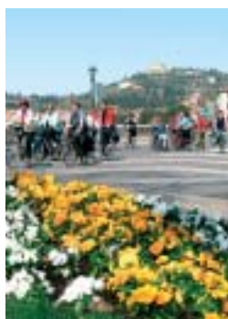
Foto di copertina: Pedaliamo PER la città