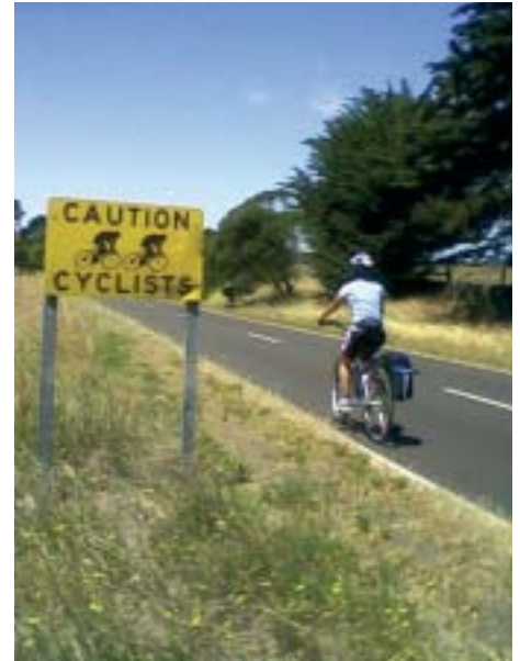
"Attenzione ai ciclisti"

Se è abbastanza frequente leggere di incidenti capitati a ciclisti le cui ruote restano 'catturate' nelle rotaie e che vengono investiti da altri veicoli in transito, è però anche vero che l'amministrazione reagisce con notevole rapidità: un mese fa, ad esempio, i pullman sono stati banditi nel