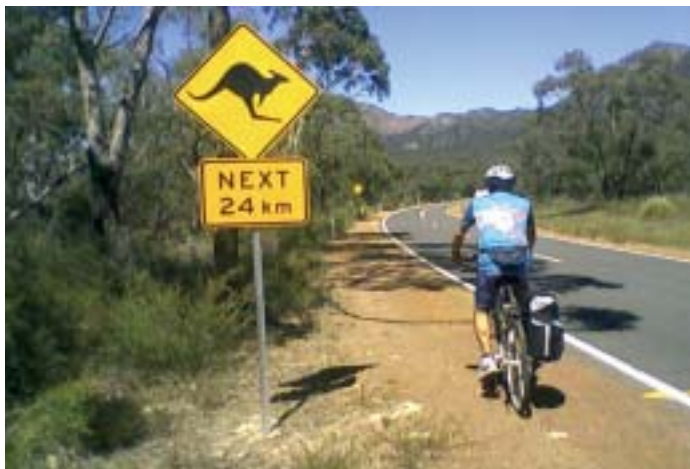
Precedenza ai "Canguri in transito"

Ancora una volta, comunque, l'amministrazione ha reagito: la polizia contrassegna (gratuitamente!) ogni bicicletta con un numero identificativo per renderne più facile il ritrovamento in caso di furto...è già qualcosa, no? E ancora: casco e luci obbligatorissimi!!