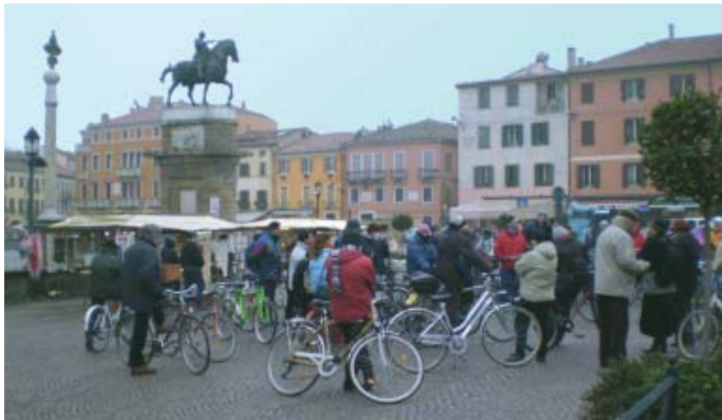
Pronti per la partenza di una gita

Il progetto è sostenuto dal Quartiere 4 sud-est di Padova e prevede la collaborazione di altre associazioni che mettono a disposizione il loro tempo e passione per accompagnare i numerosi partecipanti. La scelta dei percorsi è pensata accuratamente per promuovere la mobilità lenta e per far conoscere i percorsi ciclabili attrezzati che facilitano gli spostamenti dal centro storico verso i quartieri periferici. Il calendario domenicale