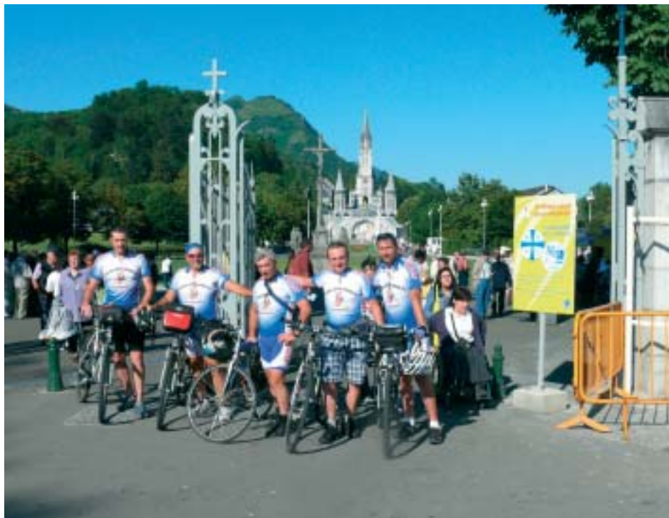
Sulla grande spianata di Lourdes

Se non li conoscete...beh, fa lo stesso. Ciao.