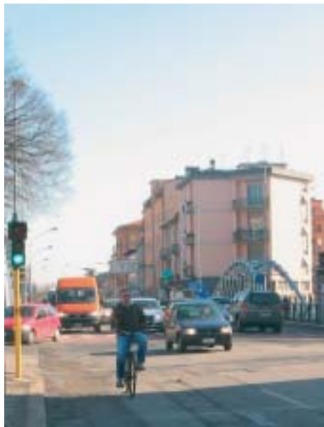
Ciclista in Corso Milano

L'articolo dell'Arena ("troppi incidenti i ciclisti lanciano l'allarme") contestato dalla signora Anti - lettere all'Arena del 23.12 - è il resoconto di una conferenza stampa che abbiamo indetto all'indomani degli incidenti accaduti a due ciclisti, un ragazzo e una signora, investiti rispettivamente da un'auto e da un camion.