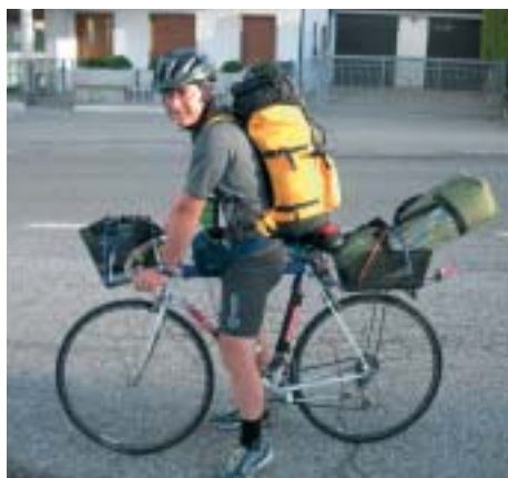
In assetto di viaggio

Non è come affrontare una vera salita o una spericolata discesa, bisogna continuamente essere "in tiro" e a sera ogni più piccolo bullone è dolente.