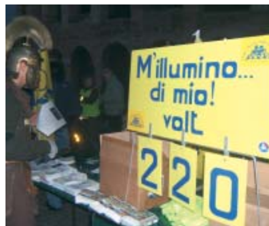
Il contagiri autarchicamente ecologico

Ormai la voce si è schiarita, in barba all'aria gelata, e la creatività scatenata produce un "Monta sulla bici Mariù, basta che pedali anche tu, gli occhi tuoi belli brillano, le nostre dinamo scintillano". 20, 21, 22, giri.