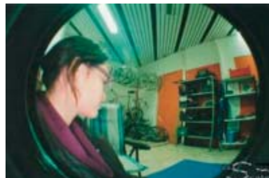
L'interno della ciclofficina

Soprattutto a Verona, dove inquinamento e isolamento sociale sono troppo spesso sgradevoli conseguenze della mentalità per cui l'unico sinonimo di "mezzo di trasporto" è "automobile".