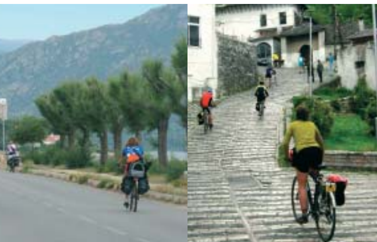
In giro per l'Europa (Corsica-Rep. Ceca)

Un momento di grande libertà che non dovrà mai trasformarsi in sofferenza o in una "brutta avventura". Meglio essere prudenti, avere un minimo di allenamento, un mezzo adeguato e grandi curiosità da appagare. Solo così, in bicicletta, potremo gustare le bellezze dei luoghi attraversati in modo del tutto diverso dall'usuale. Una domanda: sareste in grado di organizzarvi un viag-