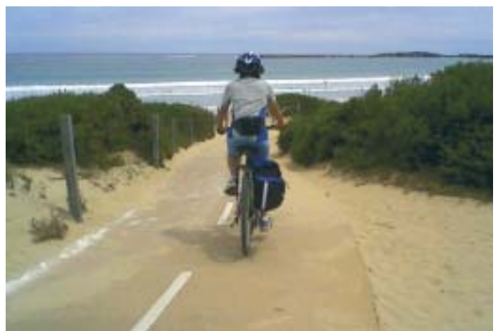
Ciclabile verso l'oceano