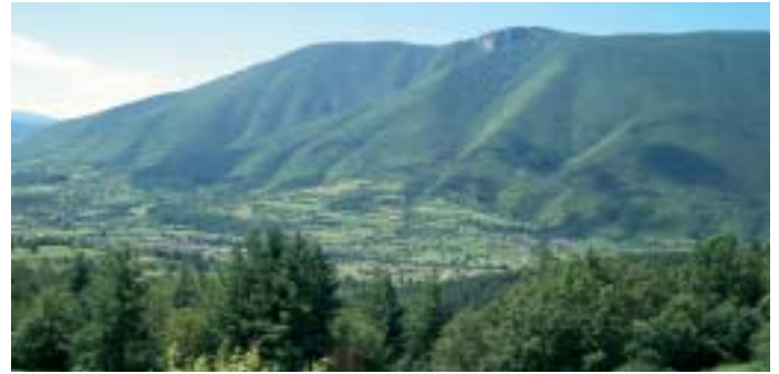
Dolce paesaggio balcanico