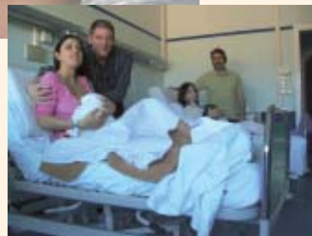
Le due famiglie AdB