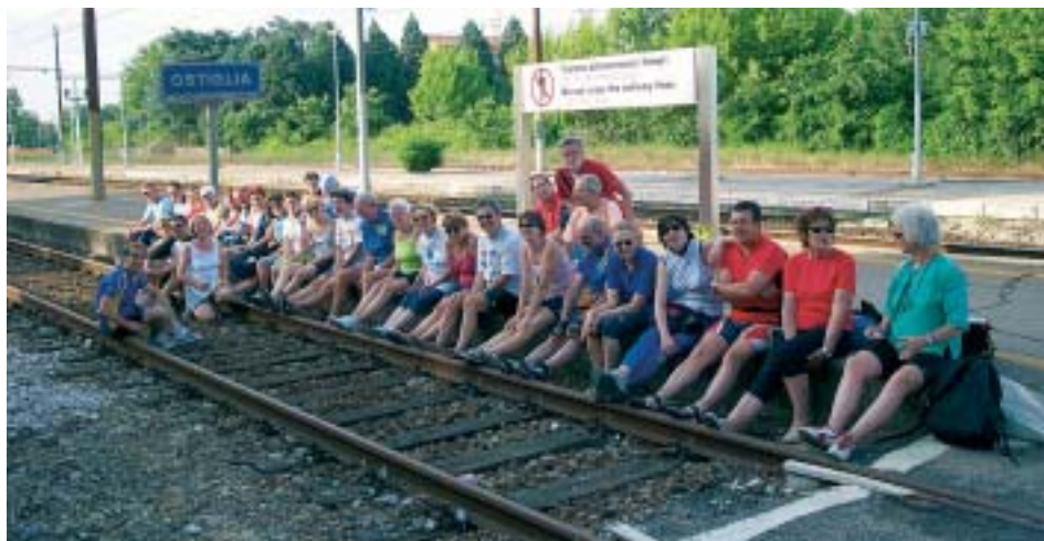
AdB a Ostiglia per l'appuntamento annuale

A supporto di queste iniziative, la FIAB (aderente alla Confederazione per la Mobilità Dolce - Co.Mo.Do.) partecipa alla Giornata Nazionale delle Ferrovie Dimenticate. Ricordando il nostro impegno ormai pluriennale sul fronte della Treviso-Ostiglia, quest'anno pedaleremo insieme per promuovere la ciclabilità dell'ex ferrovia Dolcè-Volgargne e il collegamento ciclabile della Val del Tasso con il nuovo Bicigrill di Affi il 1 marzo (vedi programma).