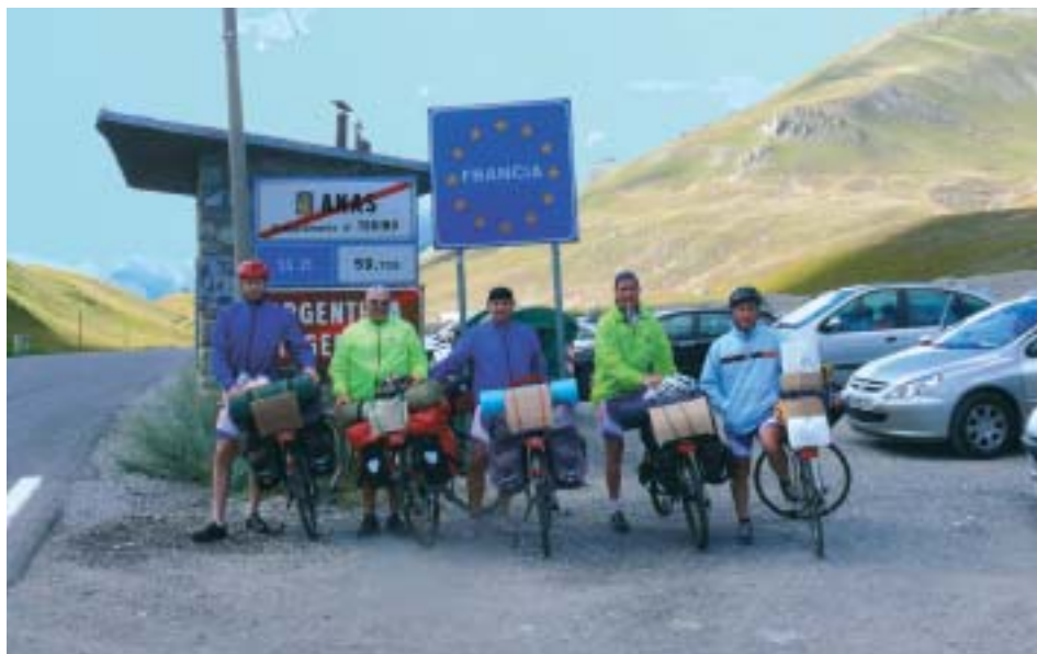
Al valico di confine italo-francese

Ma non voglio trattenermi troppo a lungo, così vi dirò che tra campeggi per la notte, strade quasi sempre affollate, città d'arte (Avignone, Carcassonne, Montpellier, Toulouse), giornate di sole e vento (forte), vigneti e verdi boschi, siamo arrivate il 19 agosto a Lourdes.