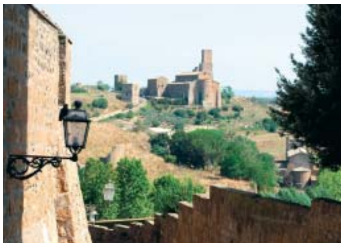
San Pietro a Tuscania

Viaggio in bus con bici al seguito da Verona a Bagnoregio all'andata e ritorno da Capalbio. Pernottamento in hotel nei pressi del centro storico di Tuscania.