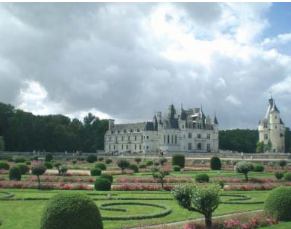
Il castello di Chenonceaux