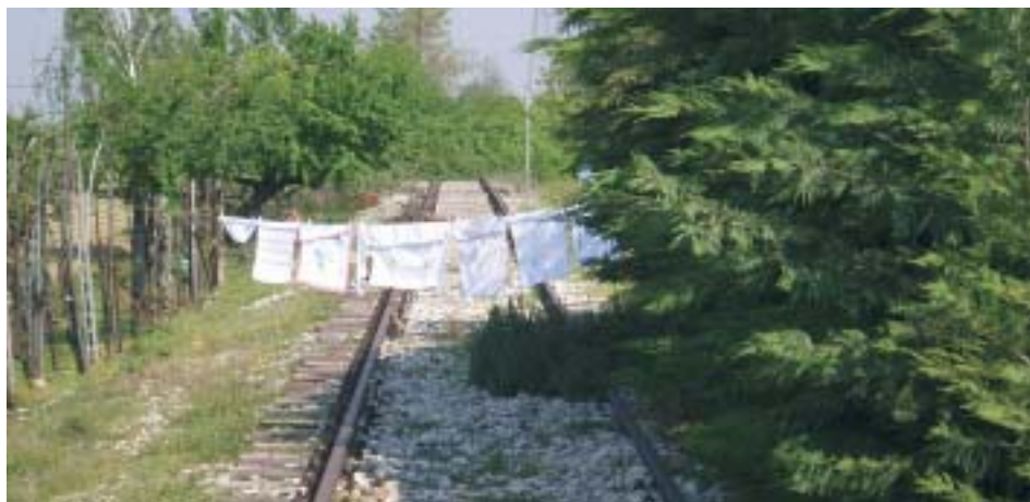
Utilizzo creativo del sedime dismesso

Diciamolo: la bicicletta dovrebbe essere benvenuta, sempre. Purtroppo capita spesso che non lo sia ed ecco allora che noi AdB-Verona, per saggiare di continuo lo stato di salute del progetto inter-