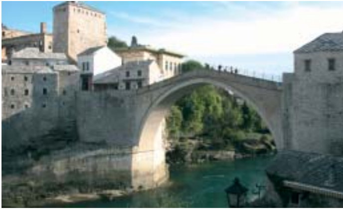
Il ricostruito ponte di Mostar

Questa cicloturistica, che toccherà anche Rijeka (Fiume), il fantastico Parco Nazionale laghi di Plitvice e Mostar, sarà organizzata da Viaggiare i Balcani, Green Tour e Promotour. Tutte e tre attive nell'ambito del turismo responsabile in Bosnia Erzegovina, sono organizzazioni che si propongono di far conoscere con questo viaggio una zona spesso poco conosciuta, ma di grande valore culturale e ambientale. Bellezze naturali e conoscenza approfondita del territorio saranno un binomio inscindibile. Ci saranno incontri con organizzazioni locali, ciclisti della zona e, in un'ottica di turismo responsabile - volto a valorizzare le risorse e l'impegno di chi investe in questo settore - sarà possibile pernottare presso privati, pensioni o agriturismi. La cicloturistica durerà due settimane, sarà a giugno e il percorso coprirà circa 750 km.