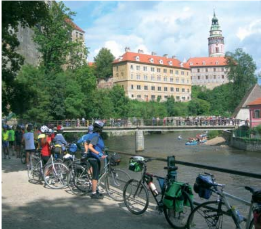
Cicloturisti veronesi in Boemia

Insomma, un sacco di motivi per iscriversi subito al "Pedala che ti passa": uscite di due-tre ore circa,