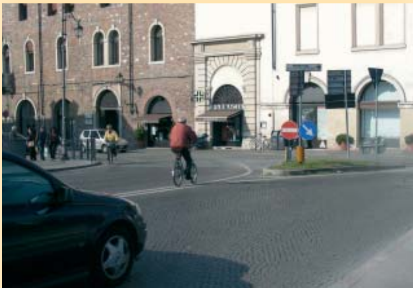
L'incrocio di Ponte degli Angeli

"Fino a qualche tempo fa la svolta a sinistra in Levà degli Angeli era consentita - si legge - poi è semplicemente sparita senza offrire alcuna alternativa ai ciclisti, a meno che non decidano di scendere e risalire dal mezzo per attraversare un passaggio pedonale. Dato però che non è possibile salire sul marciapiede per scendere dalla bici, i bravi (ex) ciclisti divenuti pedoni dovrebbero rischiare ogni volta di essere travolti trovandosi in piedi, con il fedele velocipede al fianco, in mezzo al traffico. Se l'80% dei ciclisti preferisce fare una manovra diversa, la stessa che ha originato le multe della Polizia Locale, non è sicuramente per risparmiare 5 metri, ma perché in quella posizione, con il piede sull'aiuola spartitraffico, il ciclista guarda negli occhi gli automobilisti che vanno e vengono da Levà degli Angeli, senza rischiare di essere travolto alle spalle. Sappiamo che questo costituisce un'infrazione e come Associazione abbiamo più volte denunciato la cosa ai vari assessori succedutisi nel tempo, chiedendo la possibilità di una corsia ciclabile su Ponte degli Angeli che preveda uno stop e la possibilità per i ciclisti di svoltare a sinistra in sicurezza e legalità. Se ancora non è stato fatto nulla, non è certo per colpa nostra ed esempi di questo genere sono innumerevoli in città e in particolare nel centro storico".