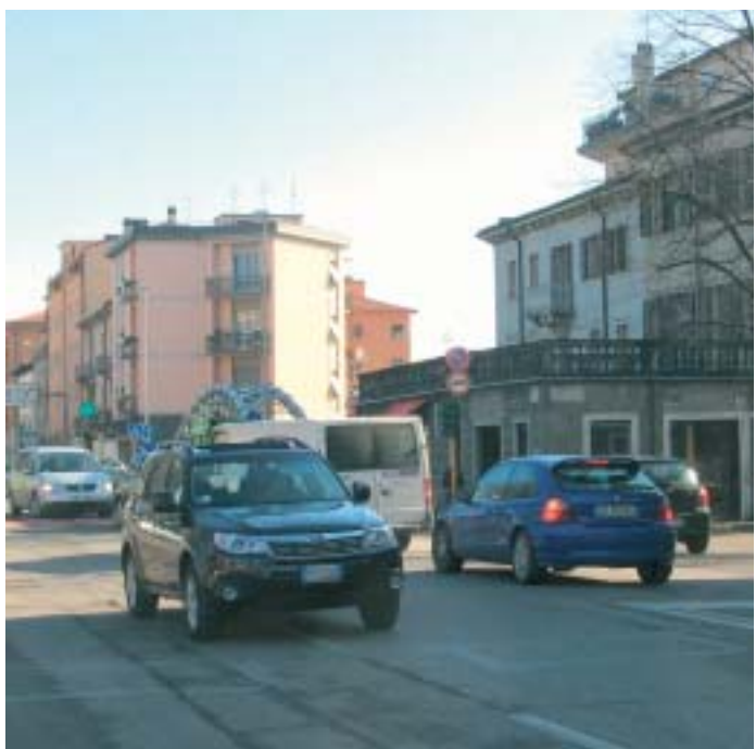
Il traffico di Borgo Milano

Fantasia? Forse la realtà la supera di gran lunga.