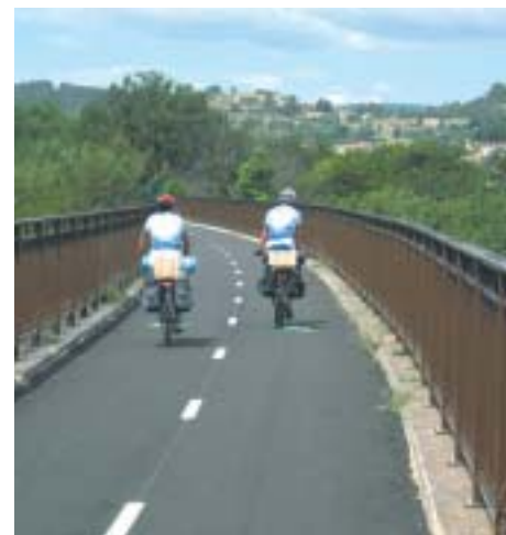
Un viadotto ciclabile

Da parte mia nessuna invidia, continuo con il mio passo senza sottoporre catena e telaio a sforzi eccessivi.