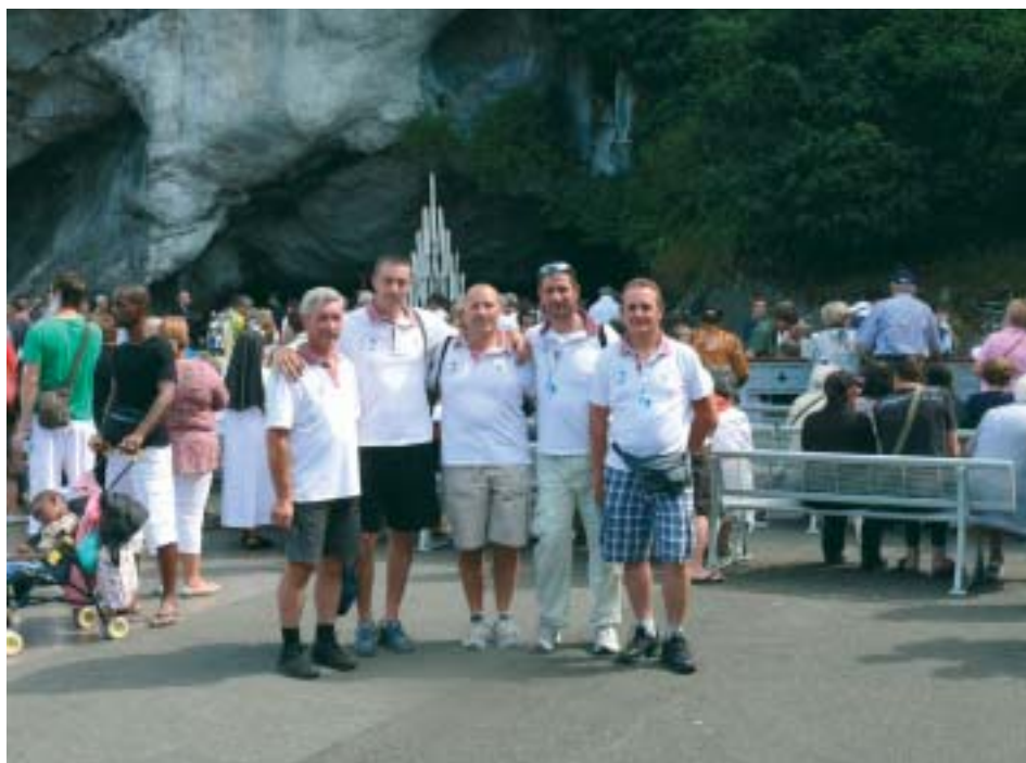
I protagonisti davanti alla grotta

La stanchezza della salita dolcemente scende dal manubrio, dalla sella, dai pignoni, dalla catena e piano piano si scarica a terra. Che dolce sensazione. Due parole scambiate sottovoce con la mia amica prima di dormire e poi... la notte. Forse per l'oramai raggiunto scopo del nostro viaggio e il desiderio di "casa" o semplicemente per evitare incidenti su queste strade italiane sempre troppo trafficate, vi sto raccontando questa storia comodamente accantonata in un vagone ferroviario, perché giunte a Torino abbiamo deciso di ritornare a casa in tre-