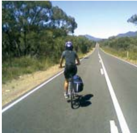
Una lunga strada australiana

Ancor più bello è che praticamente tutti questi percorsi sono raggiungibili in treno (che costa assai poco e su cui le bici sono ammesse gratis. Non solo: non c'è bisogno di prenotare nulla, i vagoni sono a livello 'terra' per cui non c'è bisogno di arrampicarsi su precariamente con le bici in spalla. Ogni 2 o 3 vagoni c'è