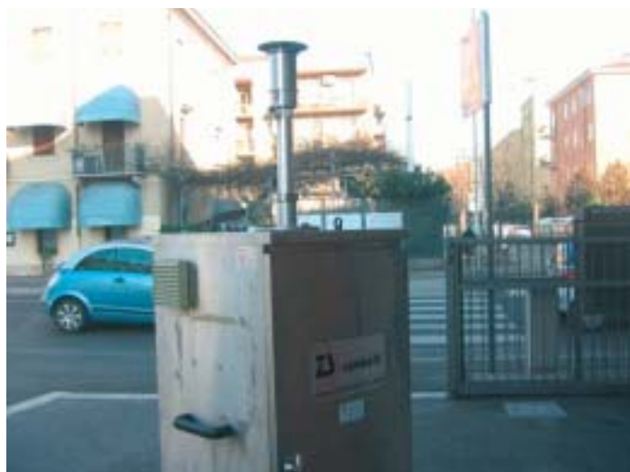
Misuratore di polveri sottili

L'apparecchio, un marchingegno enorme che sembra appena arrivato dalla luna, misurerà le polveri sottili, il livello dell'inquinamento che tutti spaventa ma la cui percezione è, come tutte le cose della vita, molto soggettiva.