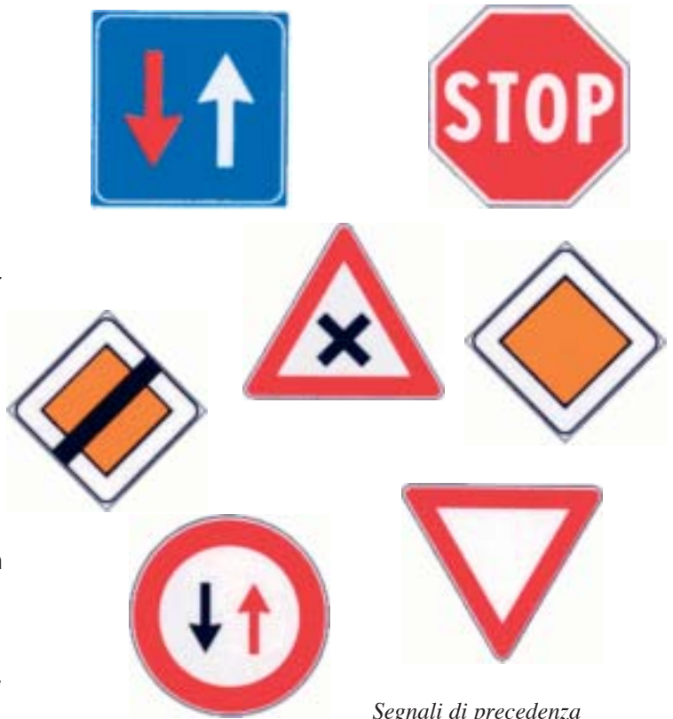
Segnali di precedenza

Ma, di contro, a tutela degli utenti più deboli - i pedoni e, secondo un orientamento ormai diffusamente recepito dalla dottrina, anche i ciclisti -