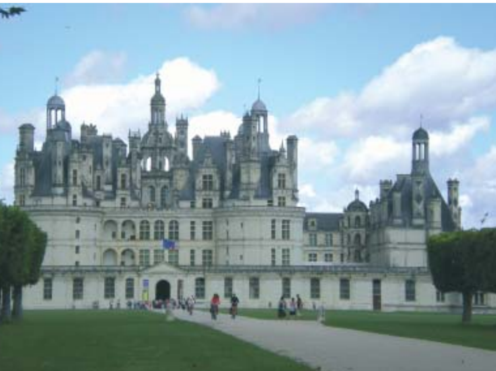
Sul viale di ingresso del castello di Chambord

mostra i modellini delle innumerevoli scoperte e invenzioni del nostro connazionale, che dalla grandiosità con cui viene celebrato in Francia sembra che abbia vissuto sempre oltralpe e non solo gli ultimi anni della sua vita!