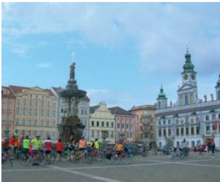
Nella piazza di České Budějovice

È obbligatorio essere soci... e prendere appunti.