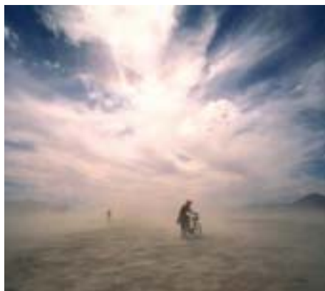
Tempesta di sabbia

solitudine, che pace. Con un sospiro di indicibile sollievo apre la portiera per discendere. Un ciclista, che procede nello stesso senso, va a sbatterci contro malamente.