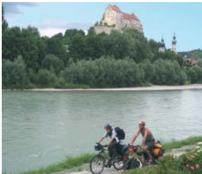
A nord di Salisburgo

turismo consapevole e mobilità sostenibile.